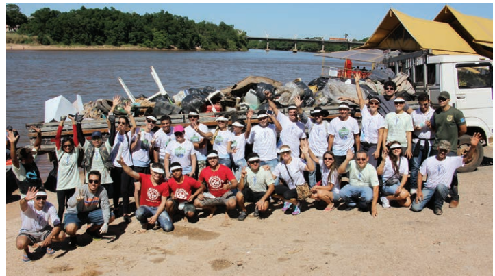
Em Barra do Garças (MT), voluntários participam de projeto que cuida da qualidade da água e retiram 3 toneladas de lixo dos rios.