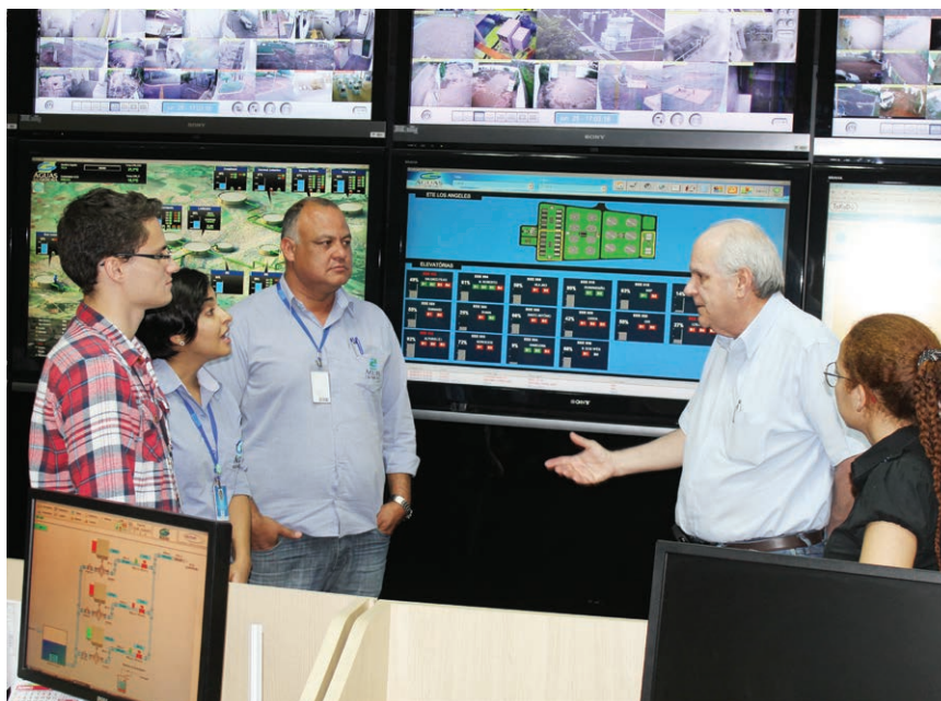
Análise da gestão da qualidade no Centro de Controle Operacional (CCO) da concessionária.