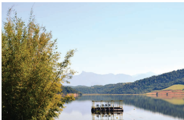
Represa de Juturnaíba vai receber mudas de árvores nativas da Região dos Lagos (RJ).

NA PROLAGOS, concessionária da Aegea na Região dos Lagos (RJ), o Dia Mundial do Meio Ambiente foi lembrado em um mês inteiro de comemorações. Entre as ações, a concessionária promoveu uma campanha que transformou cada curtida na sua página no Facebook ( www.facebook.com/prolagos ) em plantio de uma muda. As espécies escolhidas foram as árvores nativas da Região dos Lagos e a área a ser plantada foi a bacia de drenagem no entorno da Represa de Juturnaíba, em data a ser definida. Foram 235 curtidas no mês de junho. Ações semelhantes já foram realizadas também com sucesso por outras unidades da Aegea, por meio do Instituto Equipav. O foco agora foi contribuir com a conservação do manancial de Juturnaíba. “A mata ciliar é uma proteção natural, impedindo que a água fique contaminada e sem condições de uso. Por isso plantar uma árvore no entorno da represa ajudará a recuperar e proteger o ecossistema contra a degradação e ainda conserva o lençol freático”, disse Carlos Roma Jr., diretor-presidente da Prolagos e do Instituto Equipav.