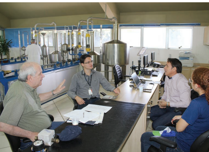
Auditor da Fundação Vanzolini realiza avaliação no Laboratório de Hidrômetros da Águas Guariroba, em Campo Grande.