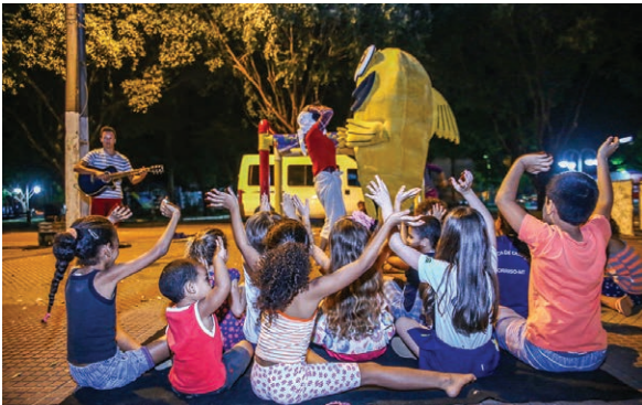
Ações da Nascentes do Xingu para comemorar o Dia Mundial do Meio Ambiente encantam crianças.

CERCA DE 980 ESTUDANTES da cidade de Sorriso (MT) assistiram ao espetáculo “Aventuras no Mundo Encanado” nas escolas municipais Vila Bela, Leonel de Moura Brizola e Geni Terezinha Forgiarini. Também foram realizadas duas apresentações na Praça da Juventude. As ações foram gratuitas e encantaram crianças e adultos com a encenação do Grupo de Teatro Faces, que de maneira lúdica e divertida ensinou sobre uso racional da água e importância do tratamento do saneamento para a preservação da natureza e a saúde da população.